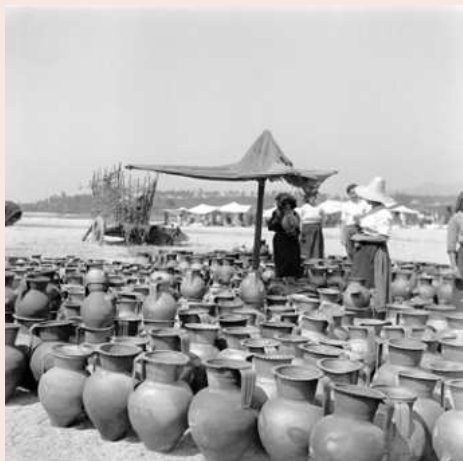
A Feira de Ponte © Conde d'Aurora