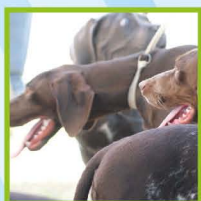
Mostra de CÃES DE MATILHA

Algumas atividades do programa poderão não realizar-se devido às condições climáticas