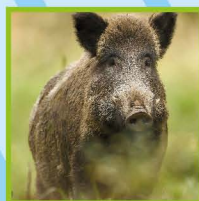
Exposição FAUNA SELVAGEM