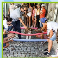
Atividades Lúdicas com CÃES