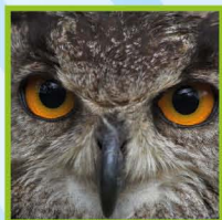
Demonstração AVES DE CETRARIA