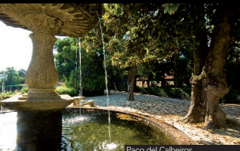
Paco del Calheiros