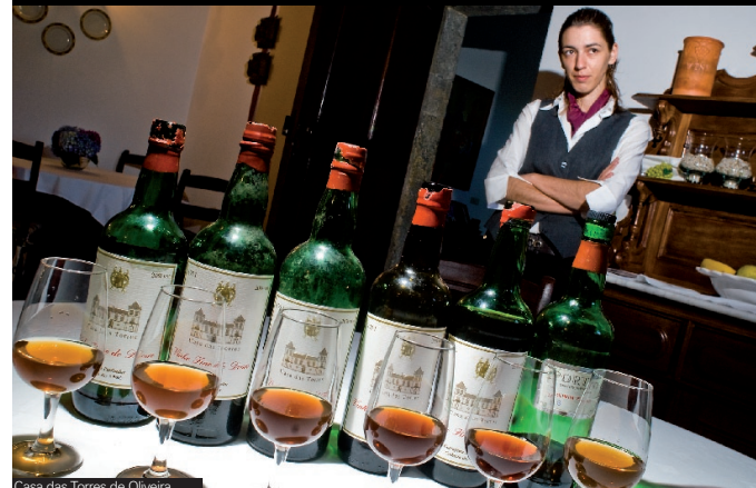
Casa das Torres de Oliveira