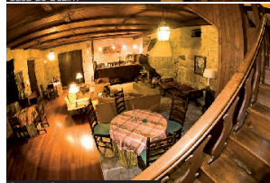
Casa de Sezim

mno piten, osvežujoč. Omizje se nikakor ne brani dodatnih kupic. Potem gospodar kot zanimivost predstavi še rdečega. Slednji izpade v svojem bistvu precej manj prepričljivo, celo nekoliko bizarno, ki-slika, lahкотnost in svežina ne gredo vtisrc s tanini, a mu kot lokalni posebnosti vseeno brez pomislekov priznamo pravico do obstoja, v širšem smislu pa tako ali tako še ne namerava igrati pomembne vloge. • Po okusnem zajtrku ogled dvorca, postanek v Ponte de Lima, kjer imajo ravno folklorni festival ... in potem proti dolinam ob reki Douro.