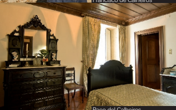
Paco del Calheiros