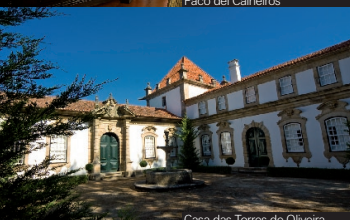
Casa das Torres de Oliveira