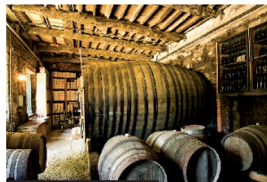
Casa das Torres de Oliveira

naročanje revije VINO: www.revija-vino.si t: 051 382 381 f: (05) 368 40 42 narocilo@revija-vino.si