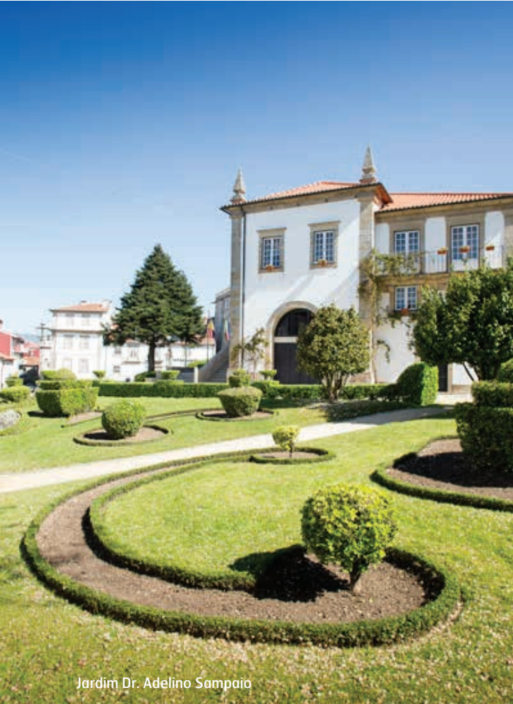
Jardim Dr. Adelino Sampaio