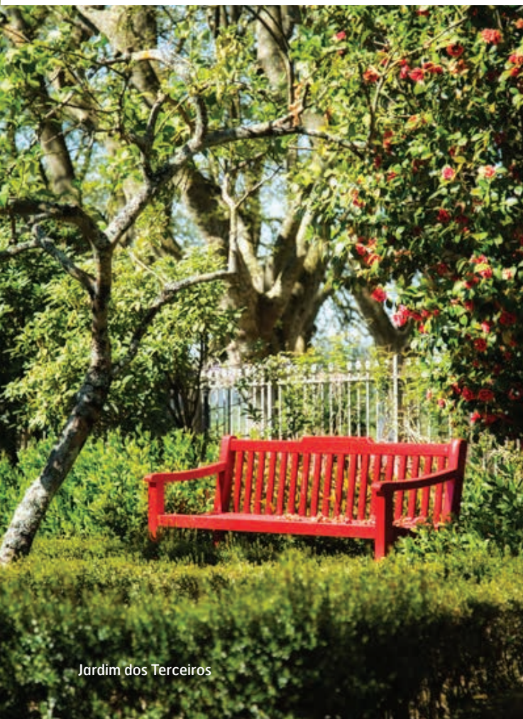
Jardim dos Terceiros