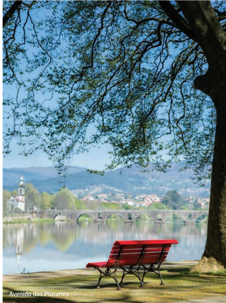
Avenida dos Platanos