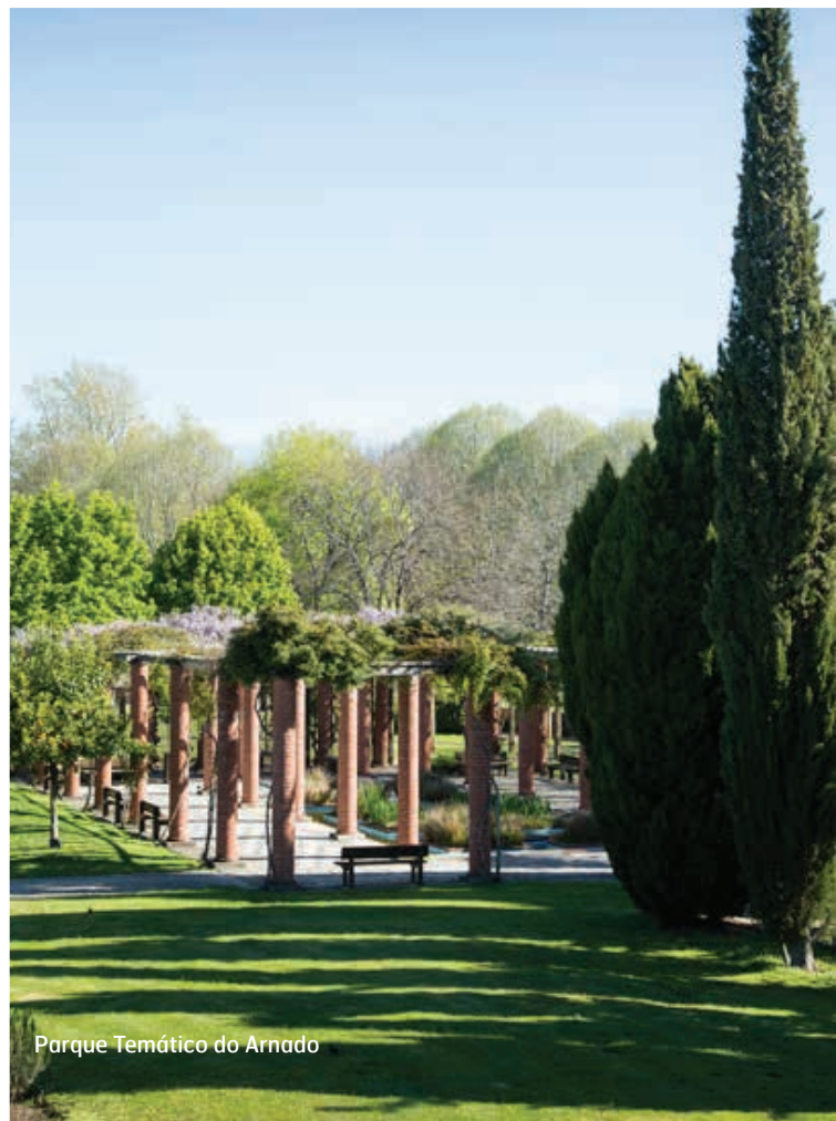
Parque Temático do Arnado