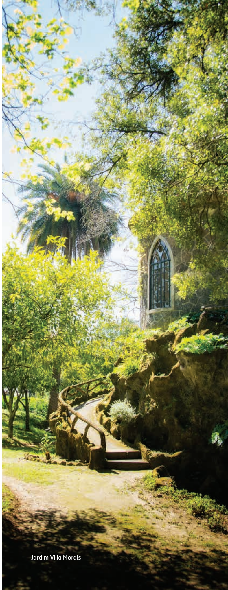
Jardim Villa Morais

P onte de Lima assume-se como a vila mais florida de Portugal. O respeito e a manutenção dos espaços verdes reflete-se na harmonia que os caracteriza. Na vila e arredores existe um conjunto notável de parques e de jardins que convidam a longos passeios, à leitura de um livro, a um descanso relaxante, a momentos de brincadeira ou de plena descontração... Conheça cinco desses locais de lazer.